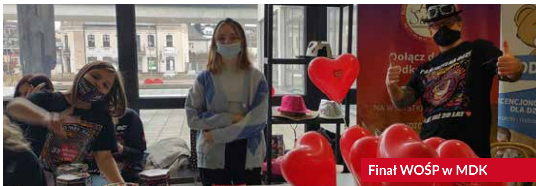
Finał WOŚP w MDK

Doskonałym przykładem, na to, że radomszczanie mają wielkie serca do po-