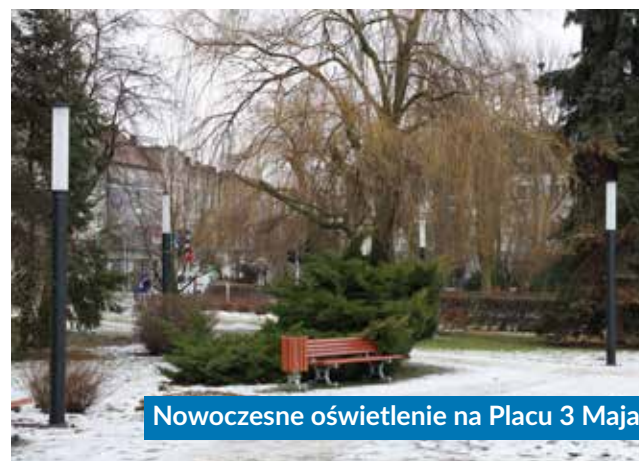
Nowoczesne oświetlenie na Placu 3 Maja