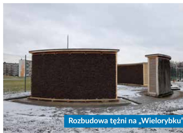
Rozbudowa tężni na „Wielorybku”