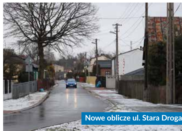
Nowe oblicze ul. Stara Droga