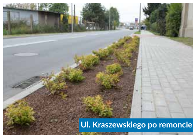
Ul. Kraszewskiego po remoncie

Przypomnijmy, że w tym roku kontynuowana jest także inwestycja łącząca rozwój infrastruktury drogowej oraz terenów zielonych – w ramach zadania „Utworzenie nowej przestrzeni terenów zielonych przy ul. Reymonta w Radomsku”. Powstanie park edukacyjny, a w nim m.in. ogród deszczowy, dwie zielone ściany, mała architektura oraz infrastruktura dojazdowa wraz z parkingiem.