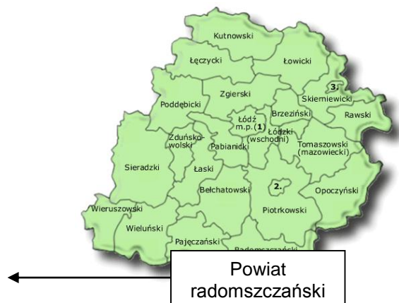
Rys. Położenie powiatu radomszczańskiego w województwie łódzkim

Radomsko jest miastem położonym w województwie łódzkim, wchodzi w skład powiatu radomszczańskiego, którego całkowita powierzchnia wynosi 1443 km 2 (144257 ha). Powierzchnia miasta (wg. danych GUS na dzień 19.02.2015r.) wynosi 51 km 2 (5143 ha), co stanowi 3,57% powierzchni powiatu radomszczańskiego. W skład powiatu radomszczańskiego wchodzi 14 gmin, a Radomsko jest jego największym i głównym miastem, które od Warszawy dzieli 190 km, od Katowic 105 km, od Łodzi 90 km, 38 km od Częstochowy i 30 km od bełchatowskiego kompleksu paliwowo - energetycznego.